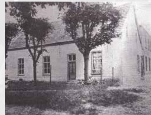
Geboortehuis van Simon van den Bergh

Op deze plek stond voorheen het geboortehuis van Simon van den Bergh (Geffen, *1819 - Rotterdam, †6 april 1907). Simon was een Joodse boterhandelaar die in 1872 in Oss startte met de fabricage van margarine. In 1891 verhuisde hij zijn bedrijf naar Rotterdam. Na diverse fusies ontstond mede uit zijn bedrijf het Unilever concern. Simon werd 'The margarine king' genoemd.